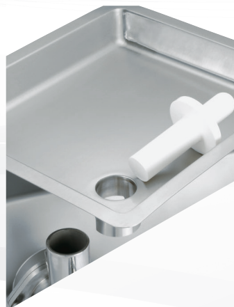
Abnehmbare Fleischschale komplett aus Edelstahl – spülmaschinenfest.