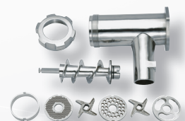
Leicht abnehmbares Gehäuse inklusive Schnecke und codiertem L&W Schneidsatz aus Edelstahl für hygienisches Reinigen.