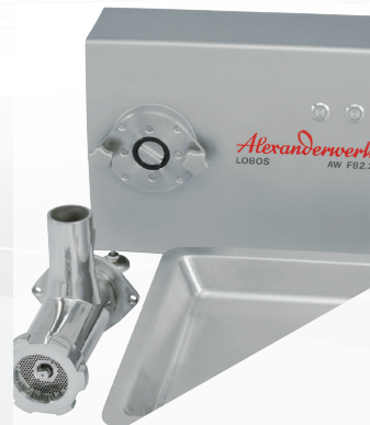
Außenliegende Antriebsnabe zur hygienischen Reinigung. Abnehmbarer Fleischwolf z. B. zur Lagerung in der Kühlung.