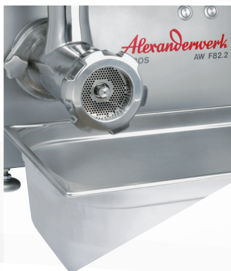
1/1 GN-Behälter unterstellbar